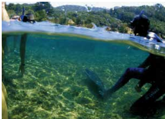
J.M. Mille © Parc national de Port-Cros