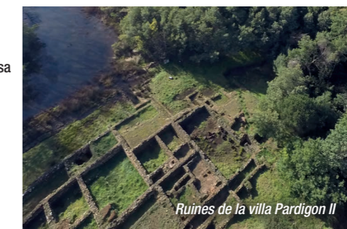
Ruines de la villa Pardigon II