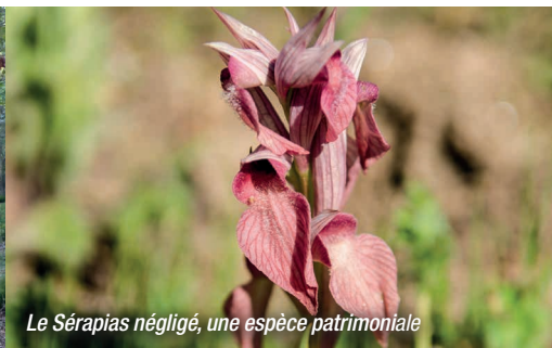
Le Sérapias négligé, une espèce patrimoniale