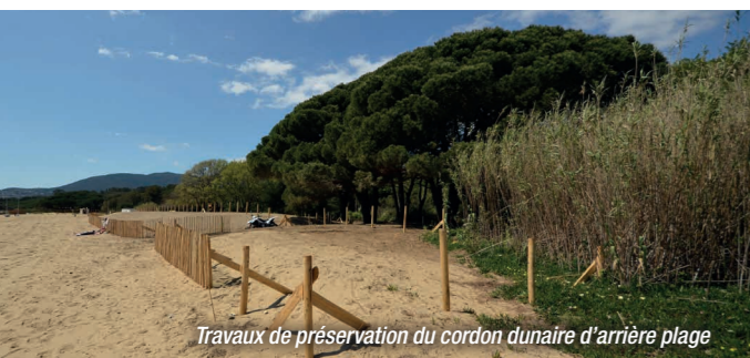
Travaux de préservation du cordon dunaire d'arrière plage