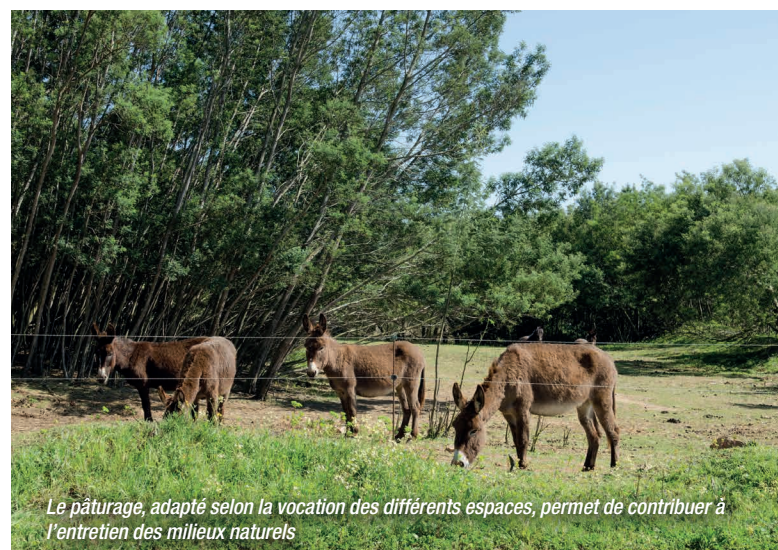
Le pâturage, adapté selon la vocation des différents espaces, permet de contribuer à l'entretien des milieux naturels