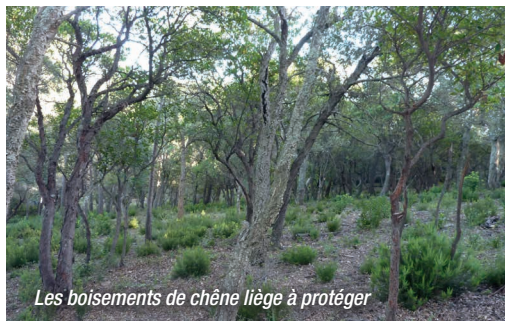
Les boisements de chêne liège à protéger

Essentiellement fréquenté sur sa partie littorale, le site va progressivement faire l'objet de travaux permettant une réouverture plus large au public.