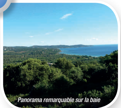
Panorama remarquable sur la baie