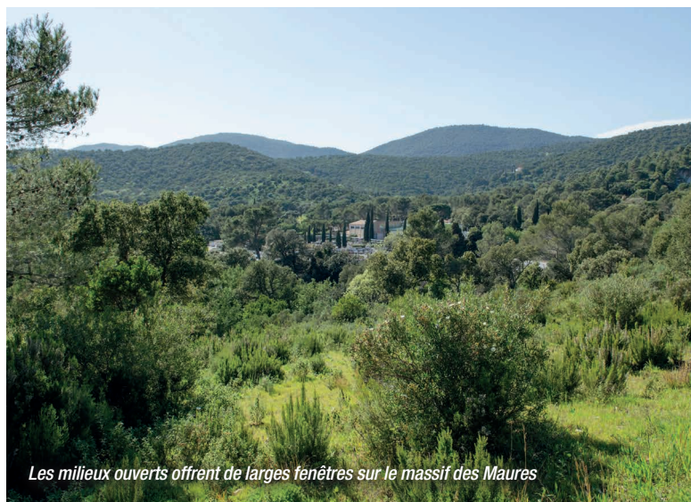
Les milieux ouverts offrent de larges fenêtres sur le massif des Maures