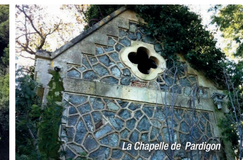
La Chapelle de Pardigon