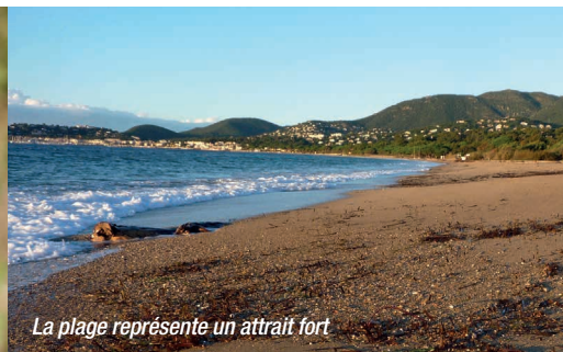
La plage représente un attrait fort